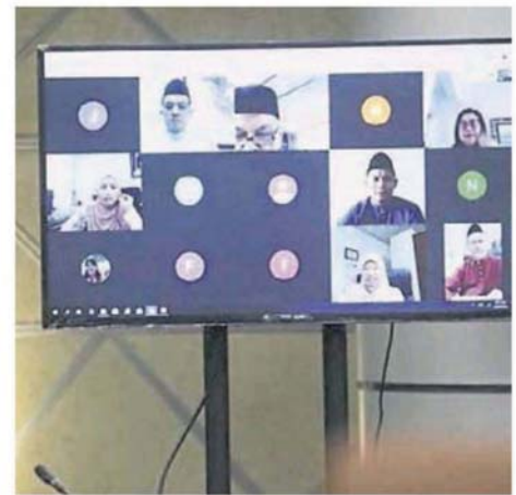
■市议员被分批，一些需到场参与会议，一些则在线参与会议。