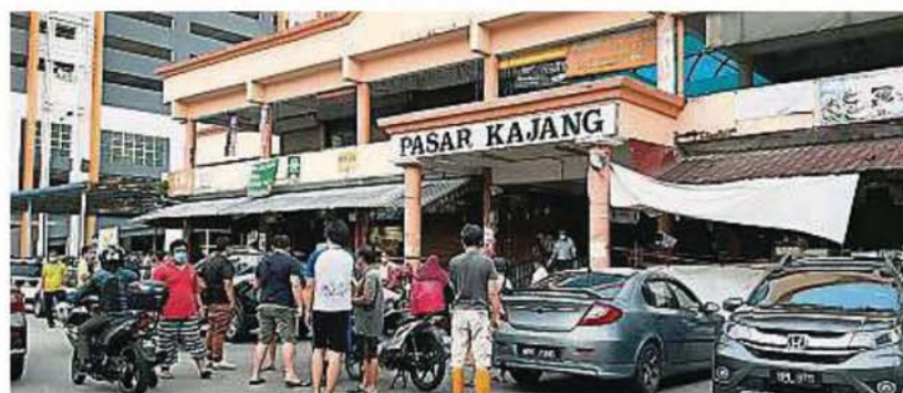
加影巴刹的小販及员工在前天完成冠病筛检，目前只有半数检测报告出炉，还有部份报告未有结果。