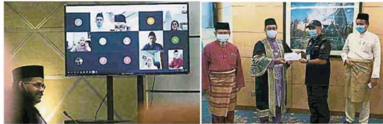
一些不使出席的市議員，也透過互聯網平台視訊開會。

他補充，其他稅收入如豁免執照費和高戒日市集的租金退還等，也影響到市政廳的稅收，所以市政廳評估今年的稅收可能比預期中減少25%。不過實際情況，還需要等到年尾才知曉。