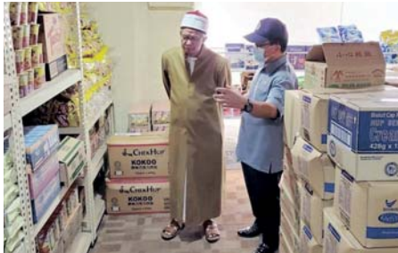
Menteri di Jabatan Perdana Menteri (Hal Ehwal Agama), Datuk Seri Dr Zulkifli Mohamad Al-Bakri meninjau stor Jawi Foodbank yang bergerak aktif setiap hari bagi menyampaikan bantuan barangan asas kepada masyarakat di Wilayah Persekutuan yang memerlukan.

Provided for client's internal research purposes only. May not be further copied, distributed, sold or published in any form without the prior consent of the copyright owner.