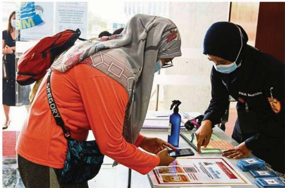
A visitor going through the Selangkah check-in process at the Petaling Jaya City Council headquarters.

Businesses welcome Selangor govt's efforts to make registration contactless and more efficient