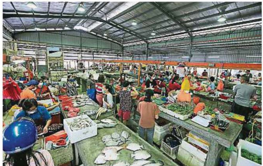
梳邦再也市議會管轄下的部分公共巴剎將於開齋節即5月24及25日關閉兩天。