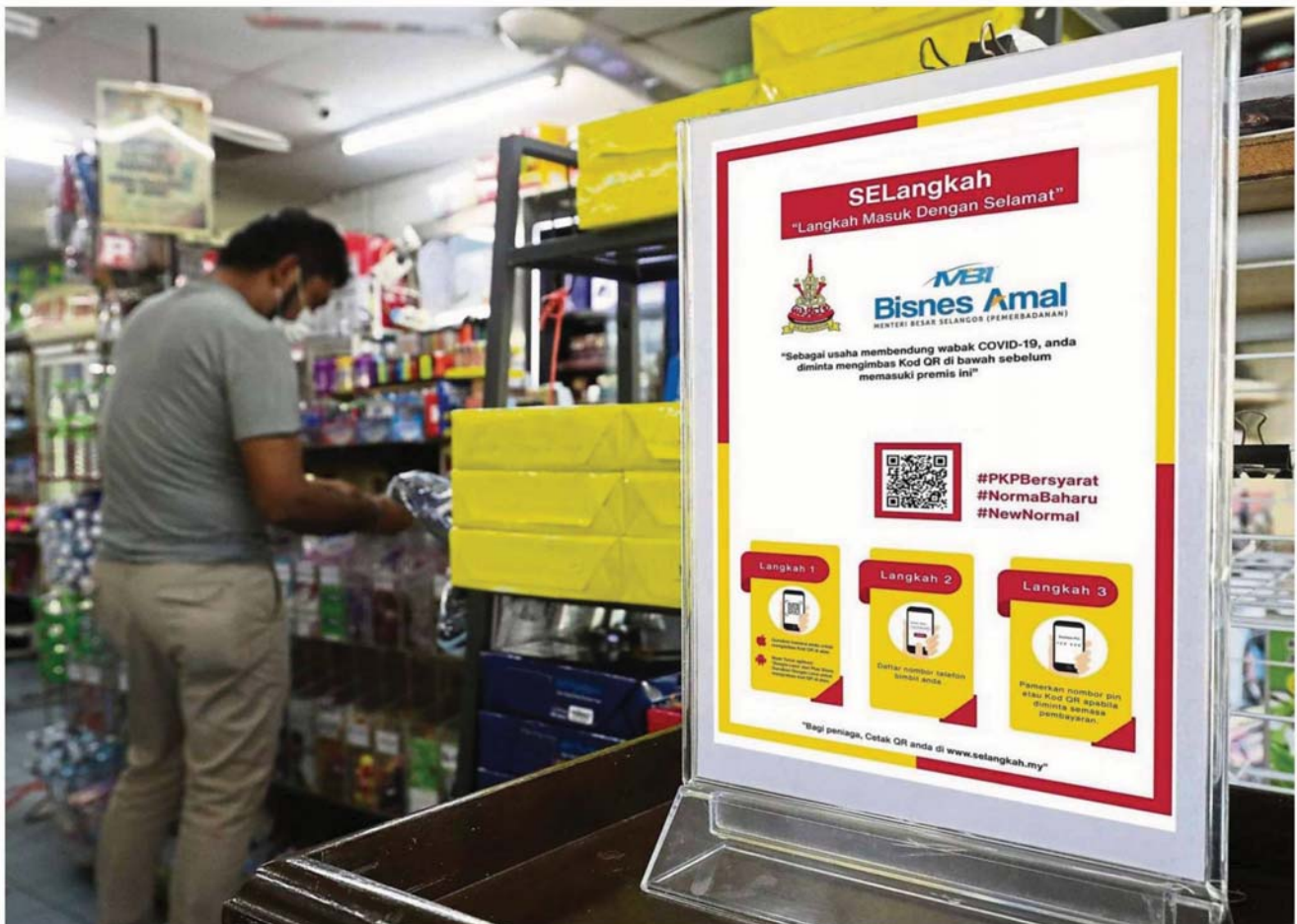
Efficient solution: Selangor business operators who use Selangkah need not manually register a person's phone number, date and time of visit as all a customer has to do is scan the QR code.

As economic activities resume under the conditional movement control order, Selangor's Selangkah digital logbook is making it easier for business operators to record customer details for Covid-19 contact tracing purposes. >2&3