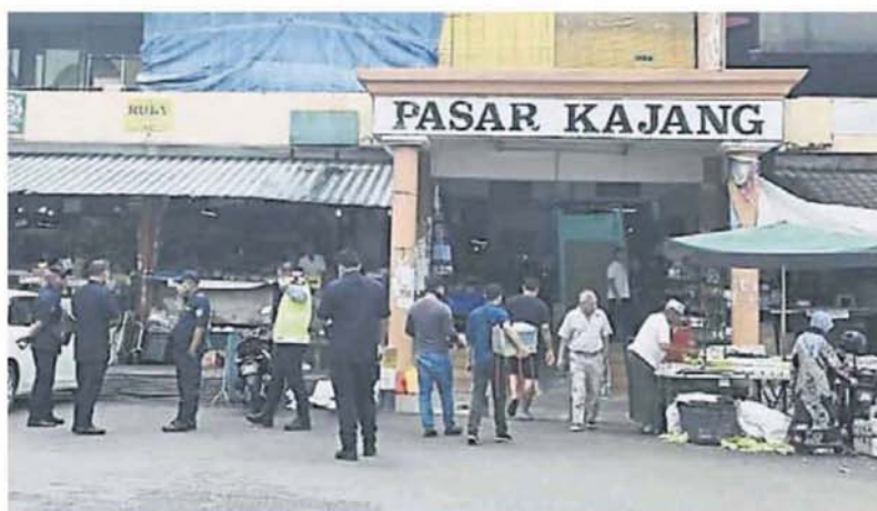
加影巴刹 3 人症状消息传开后，民众误以为是确诊而引起恐慌。