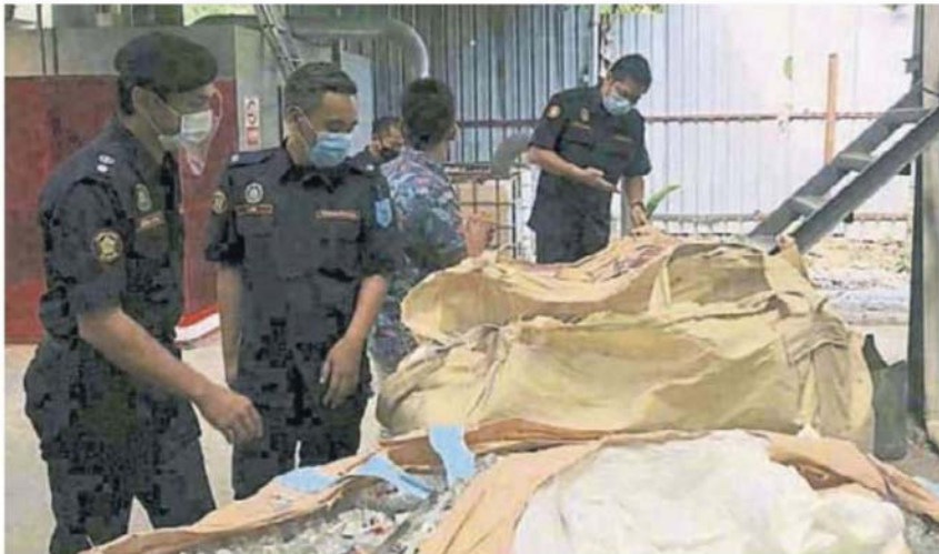
■ 加影市议会执法员日前上门检查有关工厂。