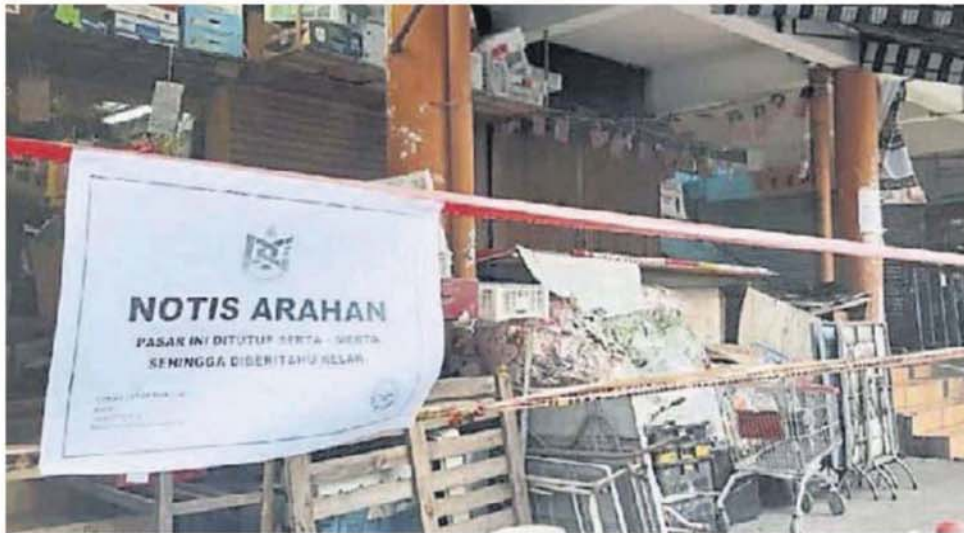
■加影巴刹出现确诊病例，紧急封锁消毒。