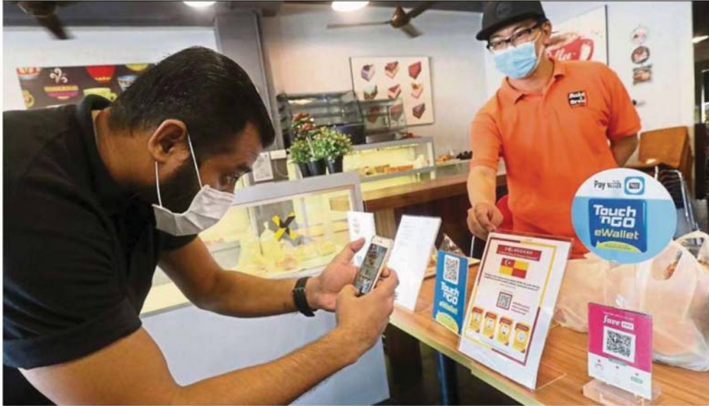
A customer at a bakery in Petaling Jaya using his phone to get the QR code under Selangkah.

Provided for client's internal research purposes only. May not be further copied, distributed, sold or published in any form without the prior consent of the copyright owner.