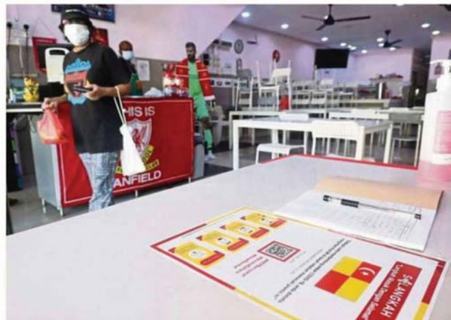
Customers who visit any government or business premises in Selangor will have to use their phone to scan the QR code upon entering the building or making payment.

Selangkah is seen as a good idea because customers are reluctant to use pen and paper to write down their personal details.