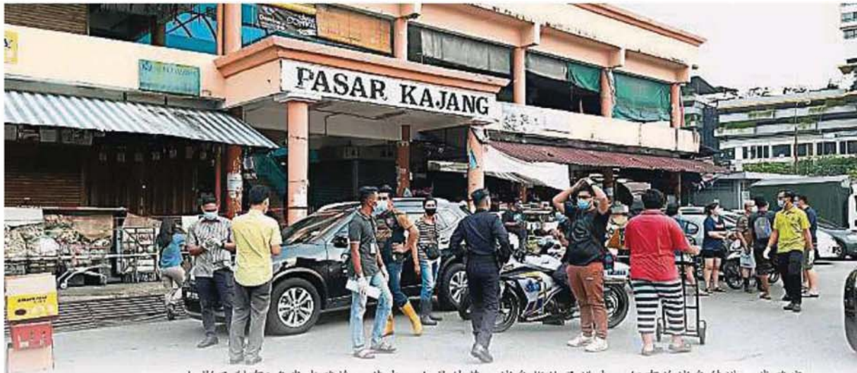
加影巴刹有3名患者确诊，其中一人是外劳，消息指他已逃走，但有关消息待进一步确定。

Provided for client's internal research purposes only. May not be further copied, distributed, sold or published in any form without the prior consent of the copyright owner.