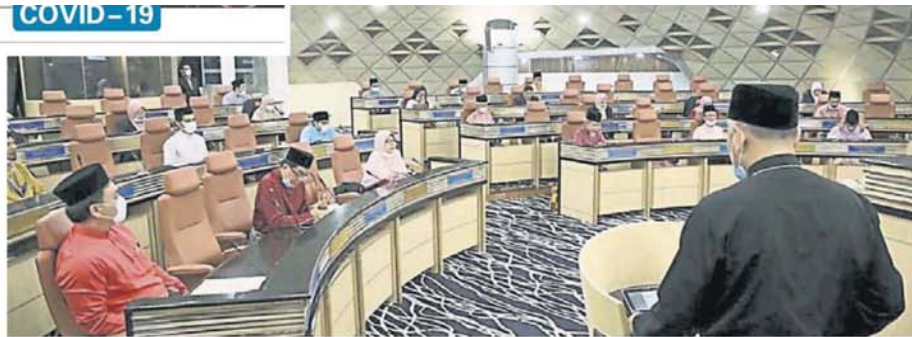
莎阿南市政厅管控令后的首个会议，出席者被安排保持社交距离座位。