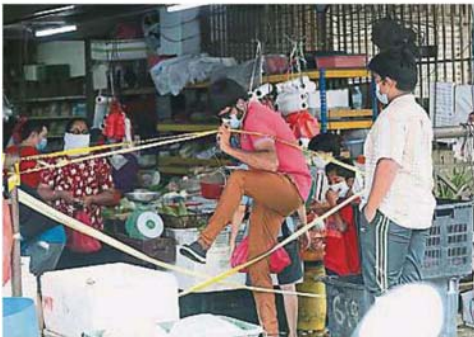
万捷巴剎原有商民不遵守規矩，私自拉開封鎖線自由進出而需要執法人員長時間駐守。

(万捷20日讯) 尽管通告的日期出错，但士拉央市议会证实其所管辖的全部6间公共巴剎，将于本月24日和25日的开斋节连关2天，直至26日方重新开业。