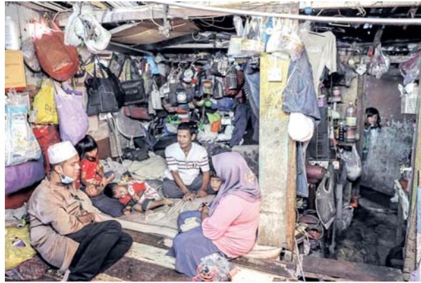
Penceramah, Ustaz Ebit Lew menyantuni sebuah keluarga yang memerlukan bantuan di Tumpat, Kelantan. Pasangan suami isteri yang mempunyai sembilan orang anak itu sudah lima tahun tinggal di rumah yang tidak mempunyai bilik.