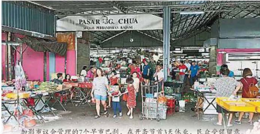
加影市议会管理的7个早市巴刹，在开斋节首3天休业，民众受促留意。