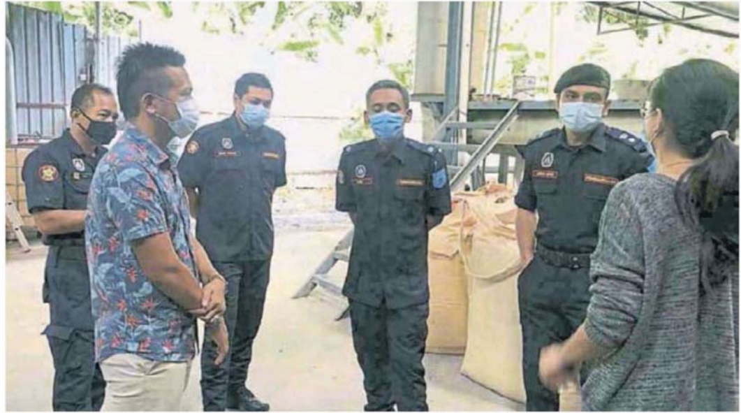
■ 执法员向工厂业者代表了解进展。

(加影20日讯) 双溪龙布迪曼工业区一间工厂疑机器发生故障, 导致工厂排出臭味和烟雾, 市议会下令有关工厂关闭。